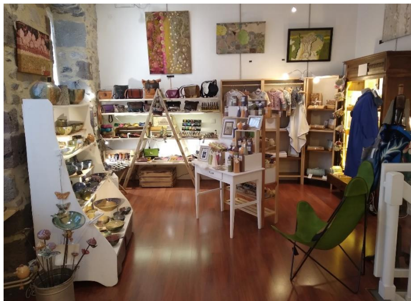
Boutique Lumières d'Ateliers

Pour participer à ce salon, vous devez :