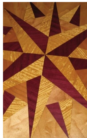
Atelier de Rochely

L'Office de Tourisme, du Commerce et de l'Artisanat souhaite mettre en lumière la diversité et la contemporanéité des Métiers d'Art en réunissant une cinquantaine d'exposants. Le jury de sélection aura le souci de n'accepter que des professionnels capables de prendre des commandes et de les exécuter à partir de matières premières qu'ils transforment ; de veiller à la présence d'une grande variété de métiers d'art.