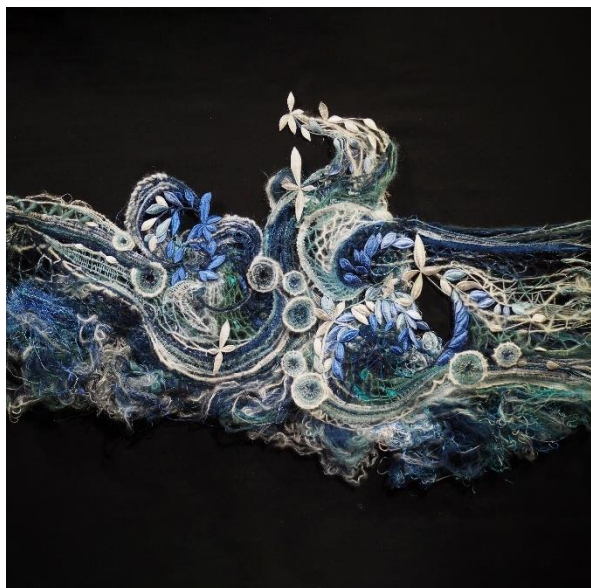
Hotel de la dentelle - La Vague