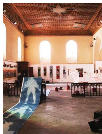
La Visitation

Brioude est également devenue un haut lieu de l'art moderne avec l'ouverture du Doyenné . Ce centre d'art moderne et contemporain propose des expositions d'envergure internationale mettant en valeur des artistes du XXème siècle comme Chagall (2018), Miró (2019), Nicolas de Staël (2021) ou encore Picasso (2022) et contemporain avec l'exposition d'Ernest Pignon-Ernest en 2023 et Hans Hartung en 2024. Avec l'exposition consacrée à Jean Dubuffet, artiste majeur de la figuration, se sont plus de 25 000 visiteurs qui ont poussé les portes du Doyenné, entre les mois de juin et novembre 2025, période d'ouverture. En 2026, Henri Matisse sera au cœur de l'exposition estivale du centre d'art moderne et contemporain.